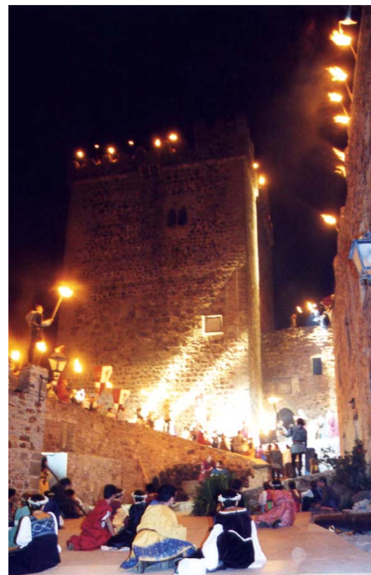
Festival Medieval.