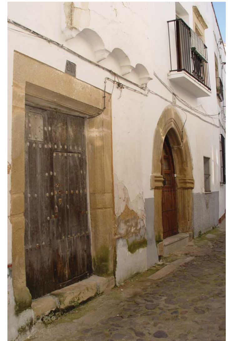
Barrio Gótico-Judío.