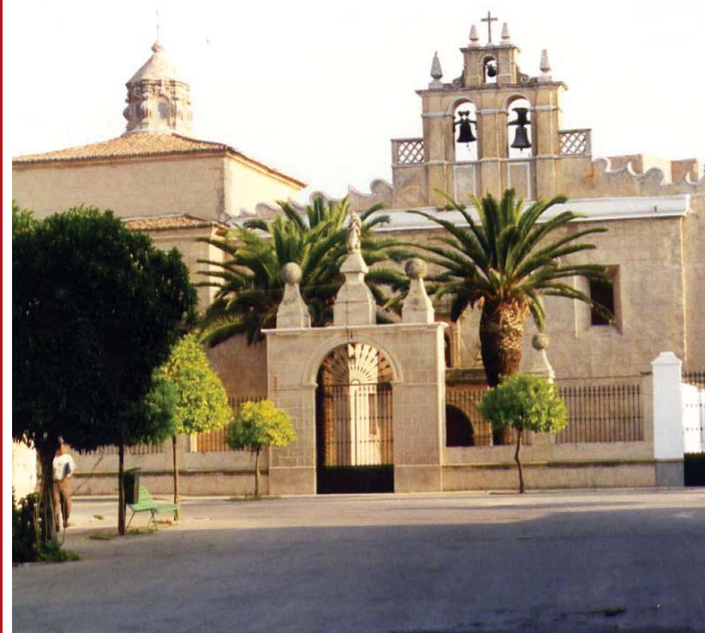
Iglesia de San Francisco.