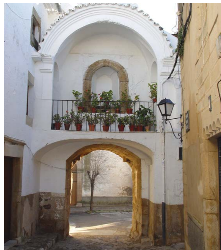
Puerta de la Villa.