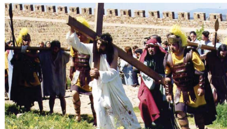
Pasión viviente.